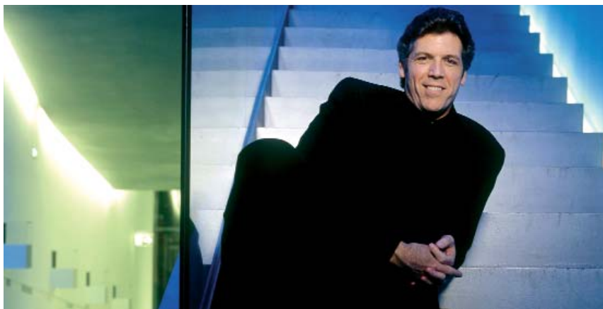
Thomas Hampson, Ehrenmitglied im Freundeskreis Heidelberger Frühling e.V.

Auch mit seiner wirtschaftlichen Konzeption ist der Heidelberger Frühling in der deutschen Festivallandschaft einmalig: Trotz des hohen Anteils an zeitgenössischer Musik, der Musik des 20. und des 21. Jahrhunderts, und der großen Zahl von Ur- und Erstaufführungen gelingt es, den gesamten Programmbereich durch eigene Einnahmen, also aus dem Verkauf von Eintrittskarten, Sponsoring und Spenden zu finanzieren. Hier spielt insbesondere der Freundeskreis Heidelberger Frühling e.V. eine Schlüsselrolle.