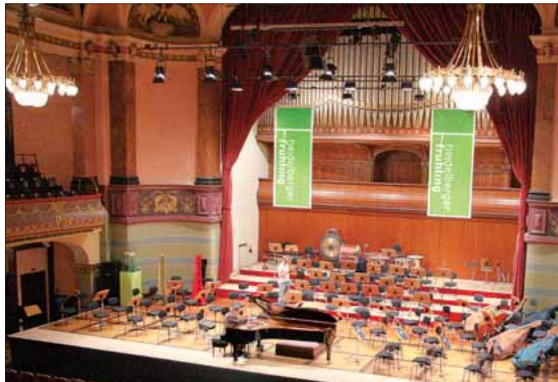
Noch ist die Stadthalle leer bis auf die Instrumente. Der Aufbau hat eine ganze Stunde gedauert. Vor allem die Pauken auf die Bühne zu wuchten ist eine Herausforderung, die sich später allerdings auszahlt.

Über den Chefdirigenten der Bamberger Symphoniker, Jonathan Nott, fin-