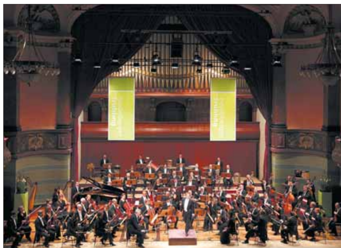
Nun kann es losgehen: Die Bamberger Symphoniker stehen bereit – auch die Pauken sind dabei.