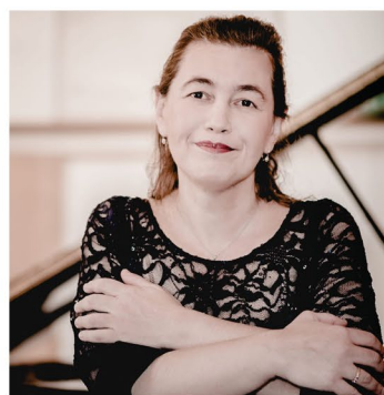
Lilya Zilberstein