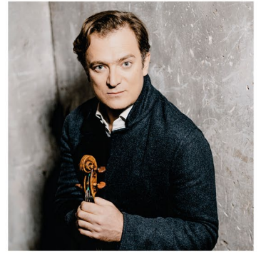
Renaud Capuçon