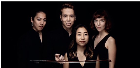
Leonkoro Quartet Streichquartett