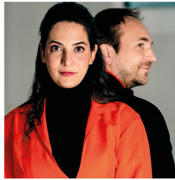
Duo EnsariSchuch