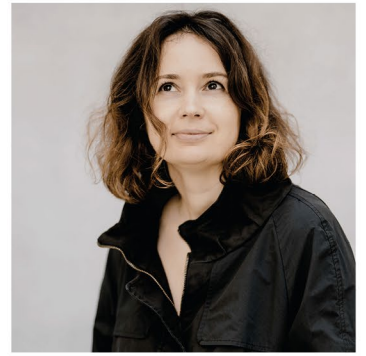
Patricia Kopatchinskaja