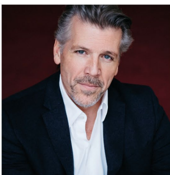
Thomas Hampson