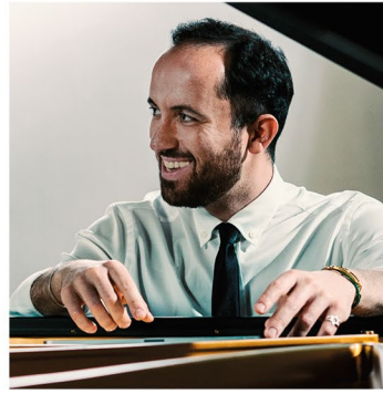
Igor Levit