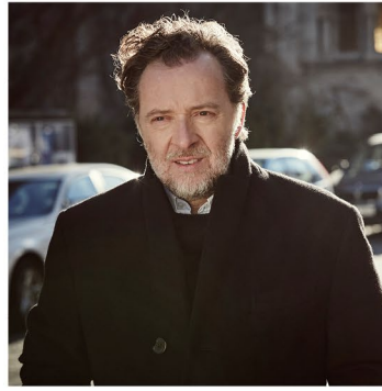
Christian Gerhaher