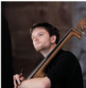
Hans Greve Kontrabass