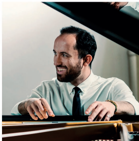
Igor Levit Klavier

In vier Konzerten sind die Fellows – junge Künstlerpersönlichkeiten aus Europa und den USA, die bei bedeutenden Wettbewerben ausgezeichnet wurden – in wechselnden Besetzungskonstellationen mit Igor Levit zu erleben. Das Spektrum reicht von Solowerken bis zum Klavierquartett, vom Duo an zwei Flügeln bis zum späten Klarinettenquintett, das die israelische Klarinetistin Sharon Kam mit den Fellows erarbeiten wird. Die Begegnung der jungen Musiker*innen im Musikfestival steht in der Tradition der Akademien des Heidelberger Frühling, bei denen Igor Levit über Jahre eine zentrale Rolle spielte. In öffentlichen Proben kann das Publikum beim Arbeitsprozess mit dabei sein. Levit ist außerdem noch in seinem Solorezital, bei dem die berühmten späten Klavierstücke opp. 116 bis 119 auf dem Programm stehen, sowie im Duo mit dem Geiger Renaud Capuçon und in einem Schulkonzert zu erleben.