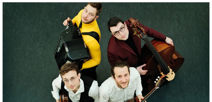
Borsch4Breakfast @Michael Wegeler