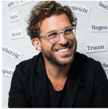
Julian Prégardien