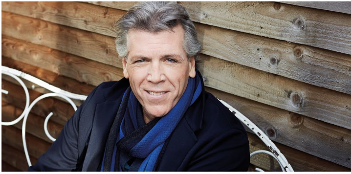
Thomas Hampson