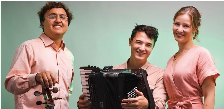
Ginkgo Trio @Ginkgo Trio