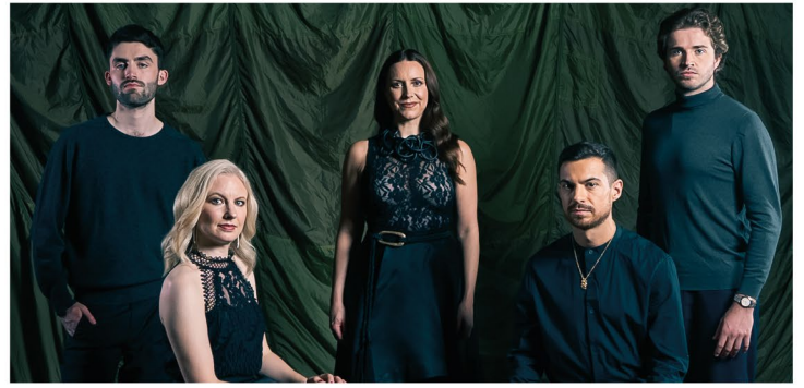
APOLLO5 @Andy Staples