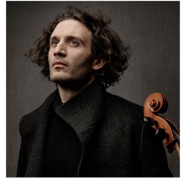
Nicolas Altstaedt