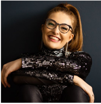
Jess Gillam