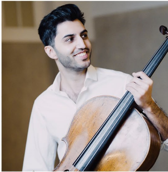
Kian Soltani