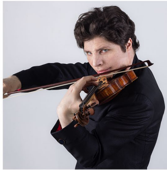
Augustin Hadelich