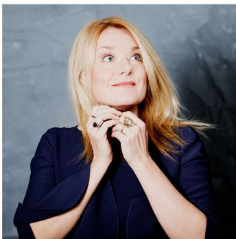
Magdalena Kožená