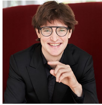
Hugo Ticciati