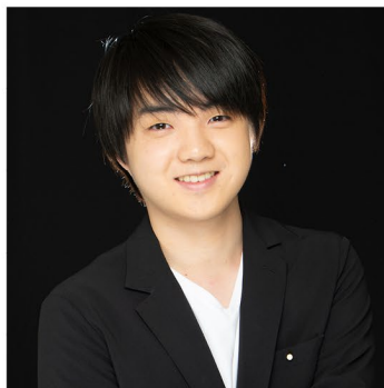
Mao Fujita