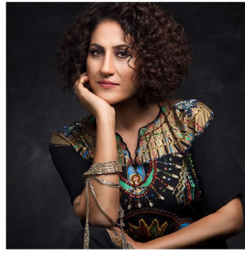
Aynur © Muhsin Akgun