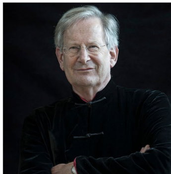
John Eliot Gardiner