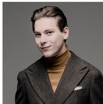
Klaus Mäkelä