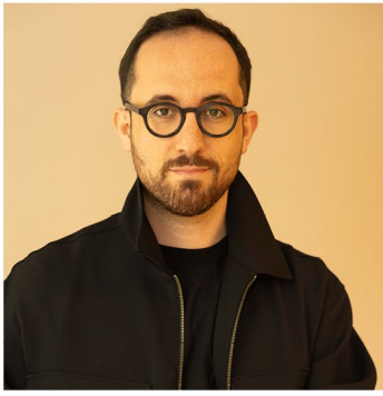
Igor Levit