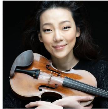
Clara-Jumi Kang