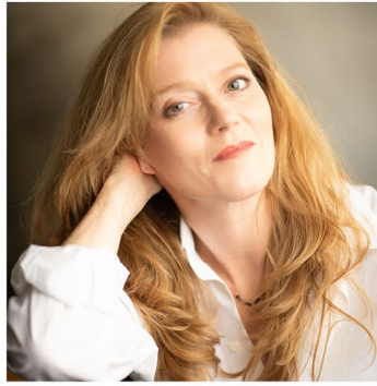
Barbara Hannigan