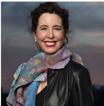
Angela Hewitt