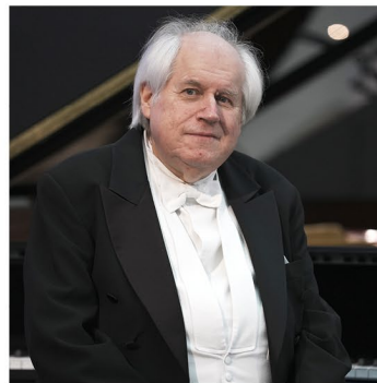
Grigory Sokolov