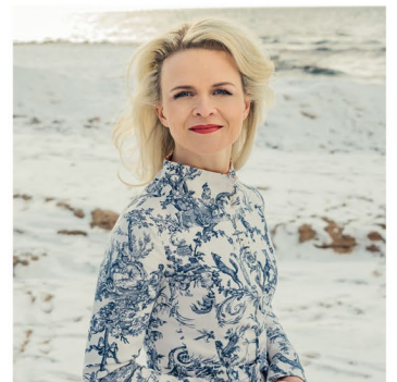
Iveta Apkalna © Aiga Redmane