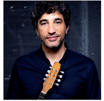
Avi Avital